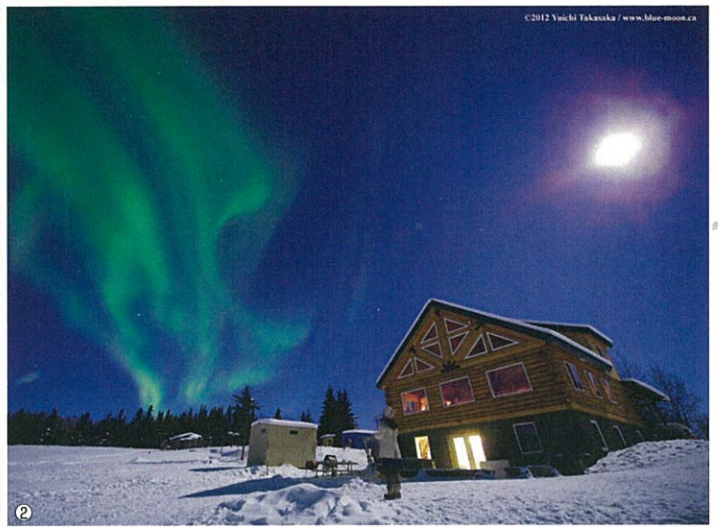
①フェアバンクス近郊のオーロラ ②月夜を照らすオーロラ ③波打つオーロラ ④冬のフェアバンクス ⑤アラスカの凍った川 ※写真はすべてイメージです。

12月12日(水) オーロラと流星群 申込締切日 11月12日(月) 2013年3月11日(月) 申込締切日 2013年2月9日(土)