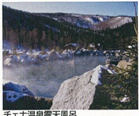
雪上車オーロラトリップ チェナ温泉露天風呂